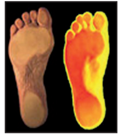
SUP - Supination

BootDoc Einlagen stabilisieren und positionieren den Fuß im Schuhwerk und helfen so den Körper in Balance zu halten. Unter Berücksichtigung der Sportart, der anatomischen Gegebenheiten und der spezifischen Anforderungen werden BootDoc Sporeinlagen sorgfältig entwickelt und produziert. BootDoc Einlagen ermöglichen die Sportart und Bewegung