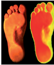
NORM - Normalfuss